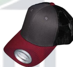
Gris oscuro/Vino /Negro