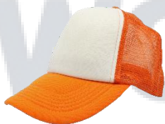
Blanco / Naranja