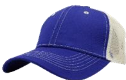
Rey / Hueso