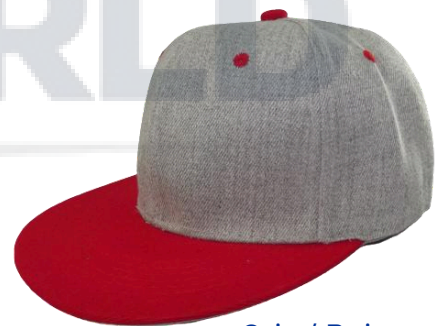
Gris / Rojo