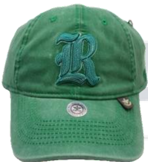
Verde Bandera Deslavado