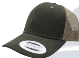
V. Militar / Kakhi