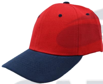
Rojo / Marino