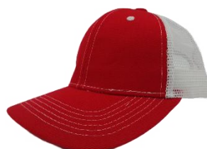
Rojo / Blanco