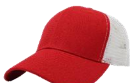
Rojo / Blanco