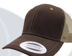
Café / Kakhi