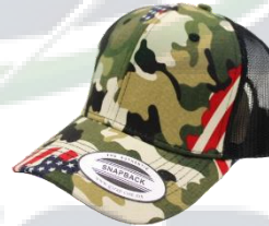
# 213 Negro