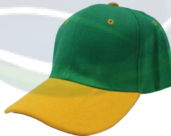
Verde Bandera / Amarillo Oro