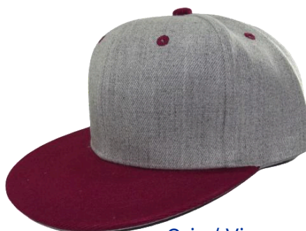
Gris / Vino