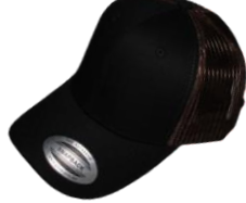
Negro / Café