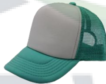
Blanco / Verde Agua