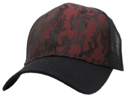
# 10 Negro