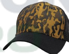
# 4 Negro