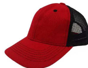
Rojo / Negro