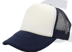
Blanco / Marino