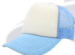
Blanco / Cielo