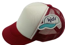
Blanco / Vino