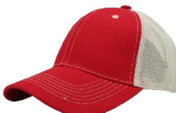
Rojo / Hueso