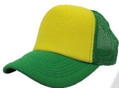
A. Claro / V.Bandera