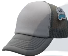
Blanco / Gris Claro