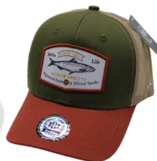
V. Militar Marrón/Kakhi