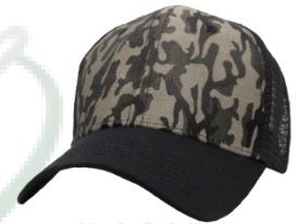
# 14 Negro