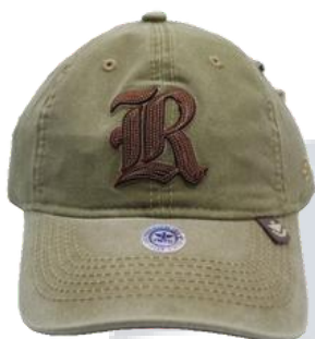
Verde Militar Deslavado