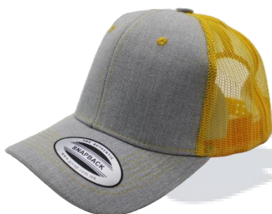
G. Claro/Amarillo Oro