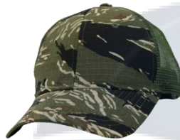
# 103 Camuflaje