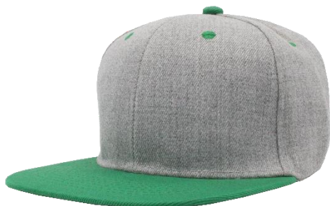
Gris / Verde Bandera