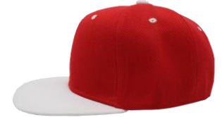
Rojo / Blanco