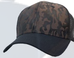
# 11 Negro