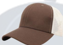
Café / Hueso