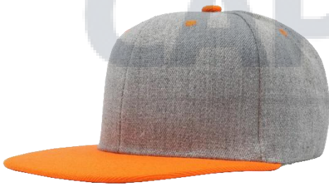
Gris / Naranja