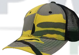
# 2C Negro