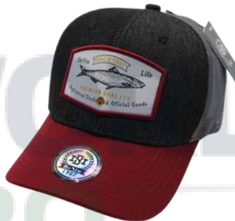
Mezclilla Negra Vino/G. Claro