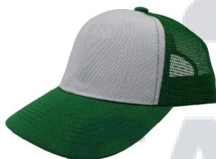
Blanco / Verde Bandera