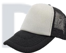
Blanco / Negro