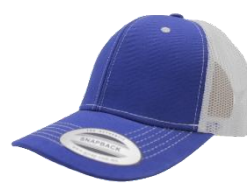
Rey / Blanco