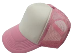
Blanco / Rosa