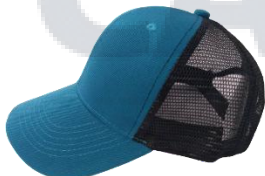
Turquesa / Negro