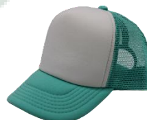
Blanco / V. Agua