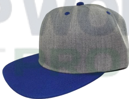
Gris / Rey