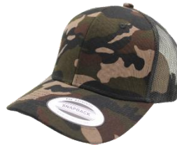
# 652-40 Negro