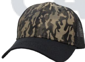
# 2B Negro