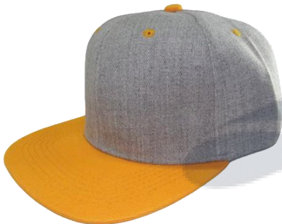
Gris / Amarillo Oro