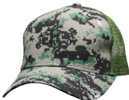
# 6 V. Militar