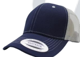
Marino/ Gris Claro