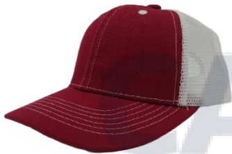
Vino / Blanco