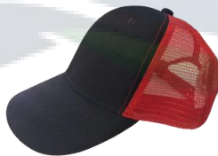
Negro / Rojo