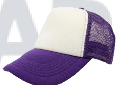
Blanco / Morado