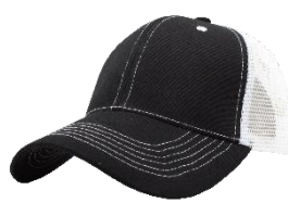
Negro / Blanco