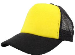
A. Claro / Negro