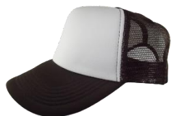
Blanco / Café