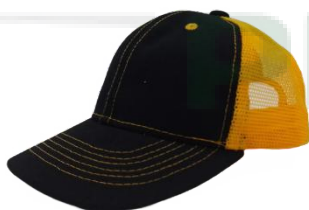
Negro / Amarillo Oro