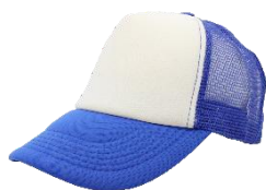
Blanco / Rey