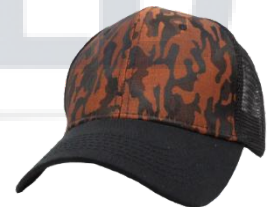
# 5 Negro