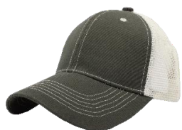
V. Militar / Hueso