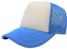
Blanco / Turquesa