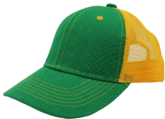
Verde Bandera/ Amarillo Oro