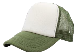
Blanco /V. Militar