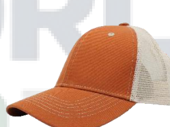
Marrón / Hueso