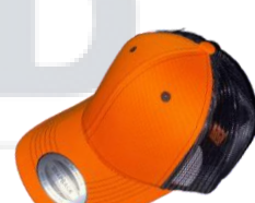
Naranja / Negro