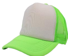
Blanco / V. Neón