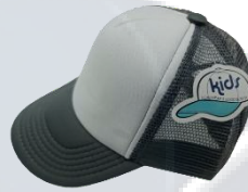
Blanco / Gris Oscuro