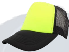
A. Neón / Negro