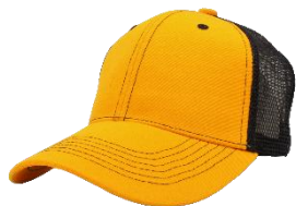
Amarillo Oro / Negro