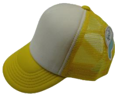
Blanco / Amarillo claro