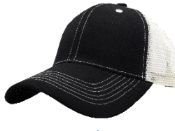
Negro / Hueso