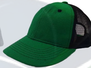
Verde. Bandera / Negro