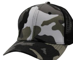
# 7 Negro