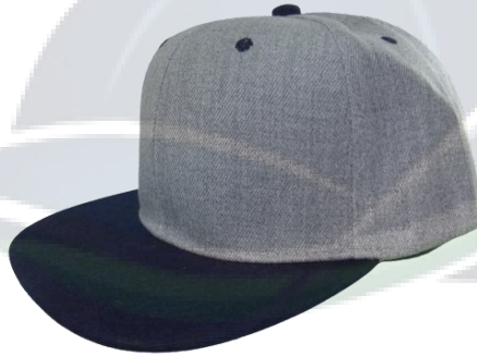
Gris / Marino