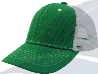
VerdeBandera / Blanco