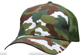
# 2 V. Militar