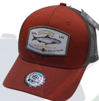
Marrón/Marrón G. Oscuro