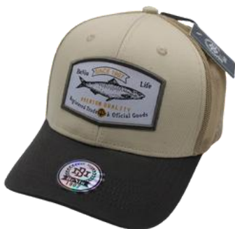
Hueso G. Osc/Kakhi

URUAPAN, MICHOACÁN CEL 443 111 2342 CEL 452 137 6687