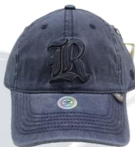
Azul Marino Deslavado