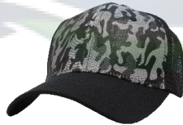
# 1B Negro