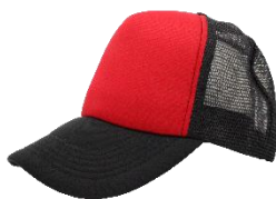
Rojo / Negro