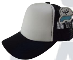
Blanco / Negro