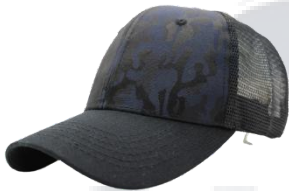
# 17 Negro