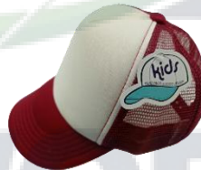
Blanco / Vino