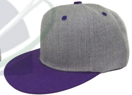
Gris / Morado