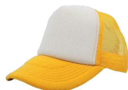
Blanco / A. Oro