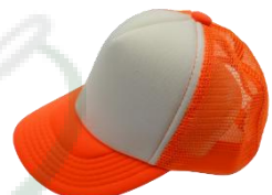
Blanco / Naranja Neón