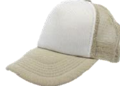
Blanco / Kakhi