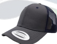
G. Oscuro / Marino