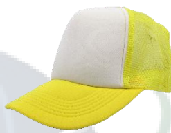
Blanco / A. Claro